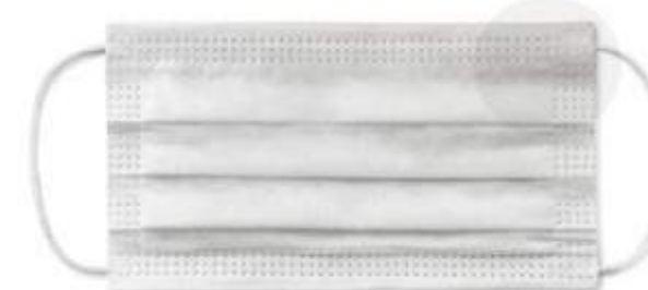
• mascherina confezionata dim. 180x100 mm, lacci 200 mm cd. Il colore in foto è puramente indicativo