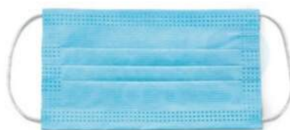
• mascherina confezionata dim. 180x100 mm, lacci 200 mm cd. Il colore in foto è puramente indicativo