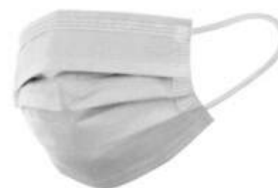
• esempio di utilizzo