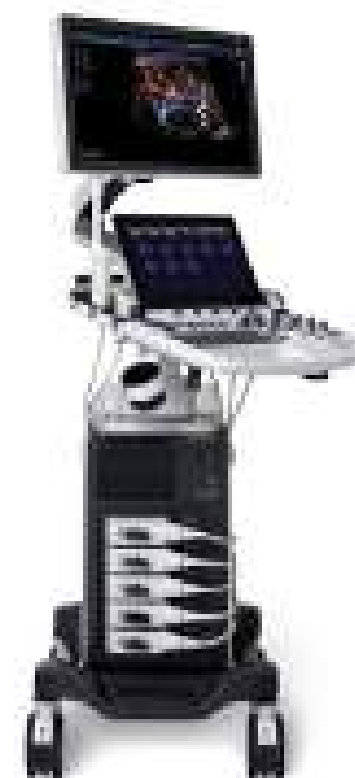
P50 (alta gamma)