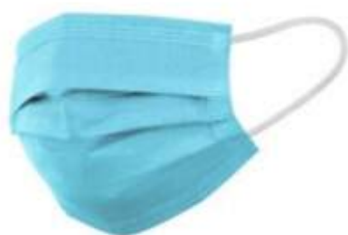
• esempio di utilizzo